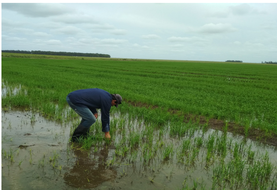
Figura 4. Arrozal bajo riego en el norte de Rocha