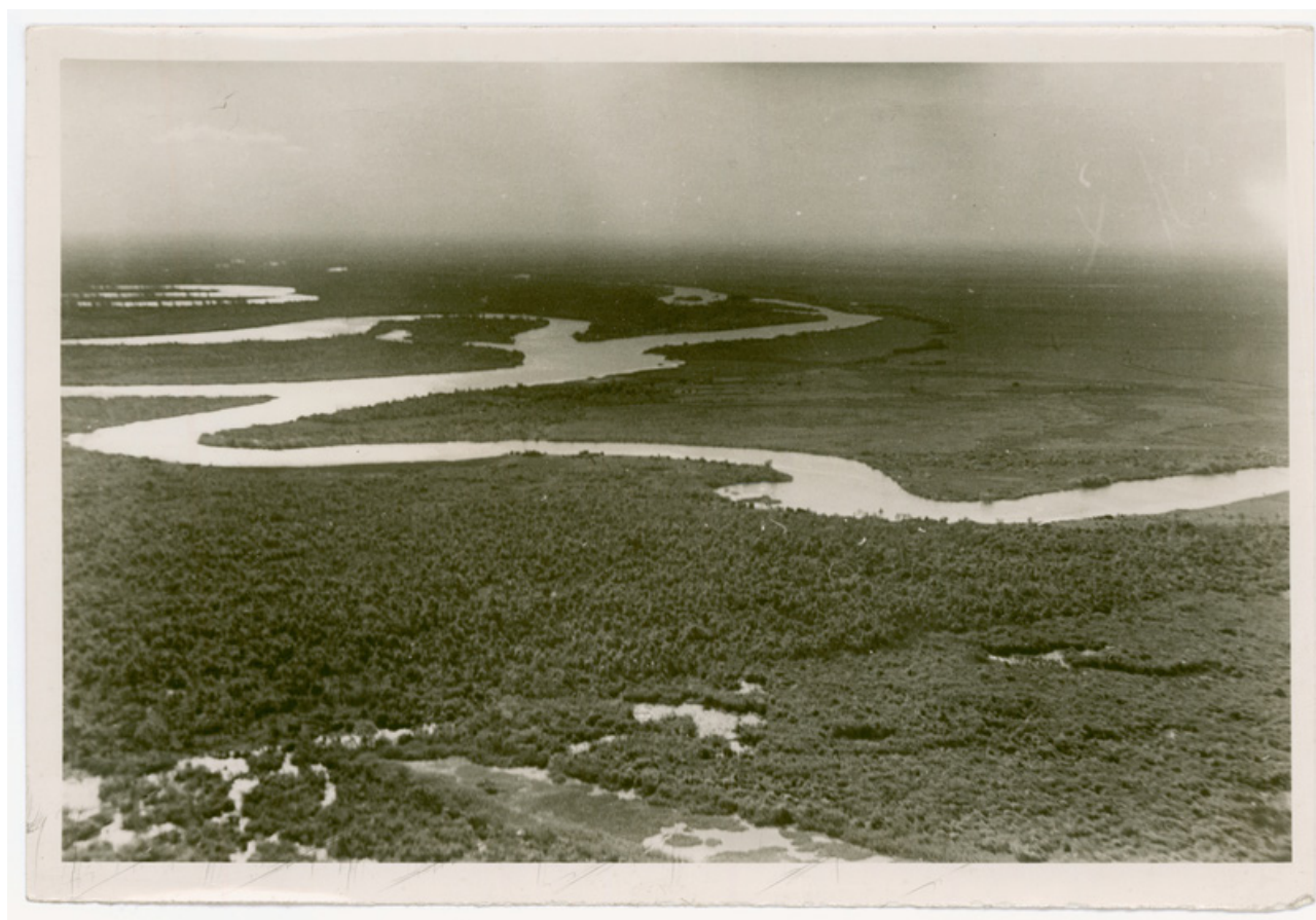
Figura 2. Fotografía de curvas del río Cebollatí en el norte de Rocha, 1950

Esta experiencia muestra en toda su crudeza las bases de la transformación que se estaba gestando, que no solo ponía a funcionar la máquina de producir, sino que al hacerlo cargaba también con un sentido patriarcal y ambiental con nuevas formas. Casi cien años después encontramos un paisaje altamente masculinizado, donde el reconocimiento está puesto en los saberes y prácticas políticas, productivas y técnicas mayormente desarrolladas por hombres. Consolidándose así un mundo de la irrigación y las ingenierías, que Zwagerteen (2006) describe como un mundo de hombres (“ a mans world ”).