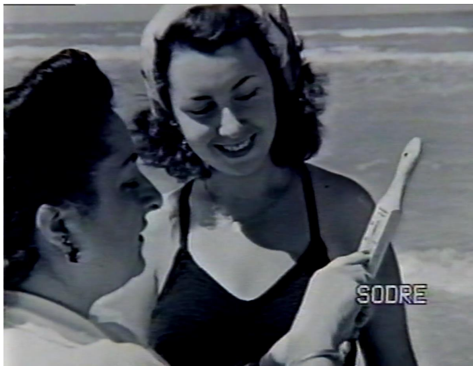
Imagen 5: El saber médico expande su control a las actividades cotidianas

arena y muestra el termómetro a la doctora que vimos al inicio. Es entonces el saber médico, sobre la base de mediciones precisas, el que determina si los niños tienen permitido jugar en el agua.