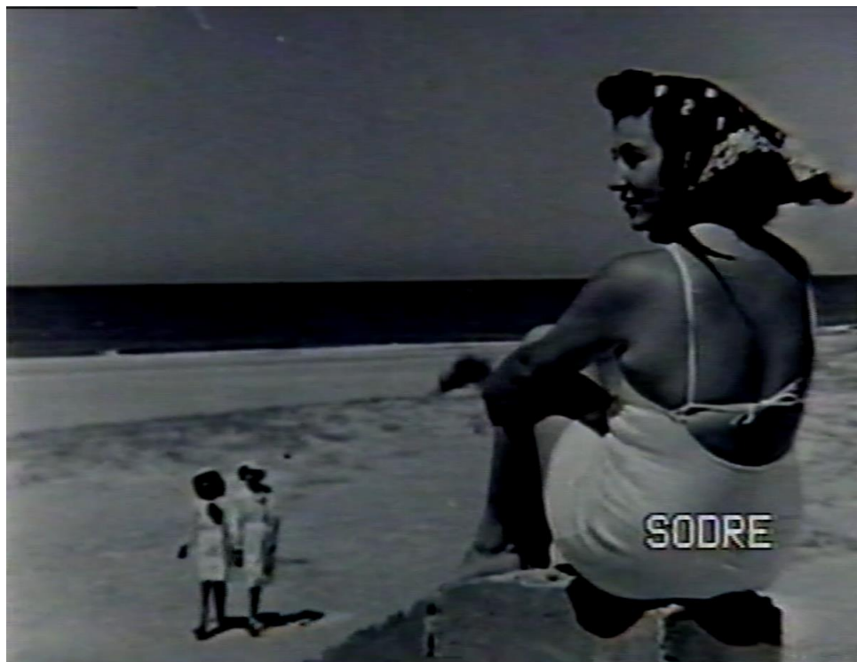
Imagen 8: Adopción de estéticas publicitaria de comunicación visual