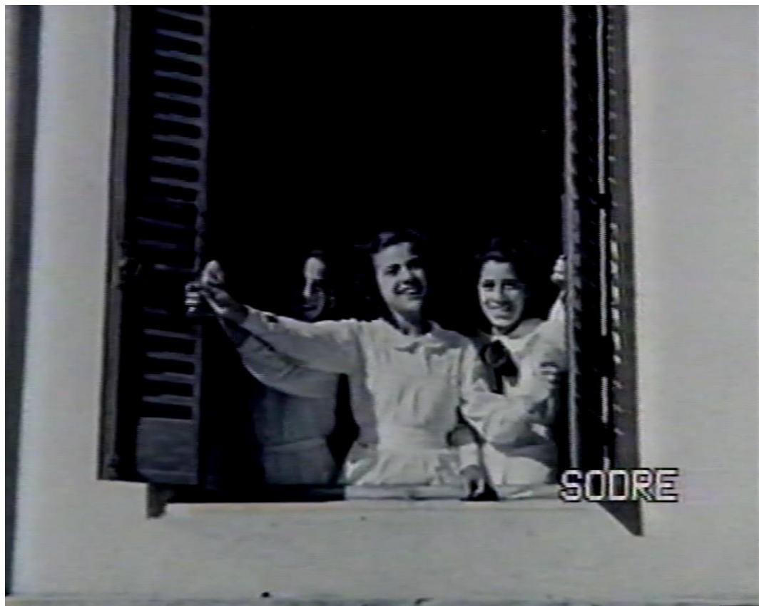
Imagen 6: Representación de las actividades cotidianas de la colonia