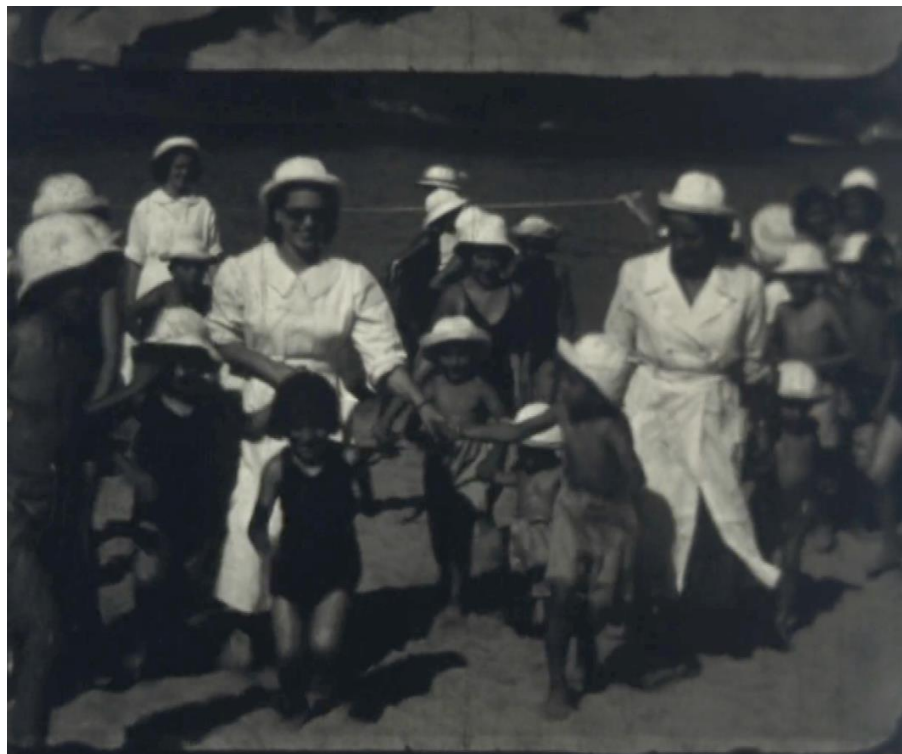
Imagen 1: Los niños corren hacia la cámara dirigidos por el realizador del film

para que el que esté detrás pueda saltar y ubicarse en primer lugar. En la película, cuando están ya todos formados en posición, un niño cambia de idea y en lugar de saltar empuja al de adelante, lo que ocasiona una cadena de empujones. El camarógrafo corta rápidamente la filmación, que reinicia a continuación con otra toma del rango, que esta vez transcurre sin conflictos.