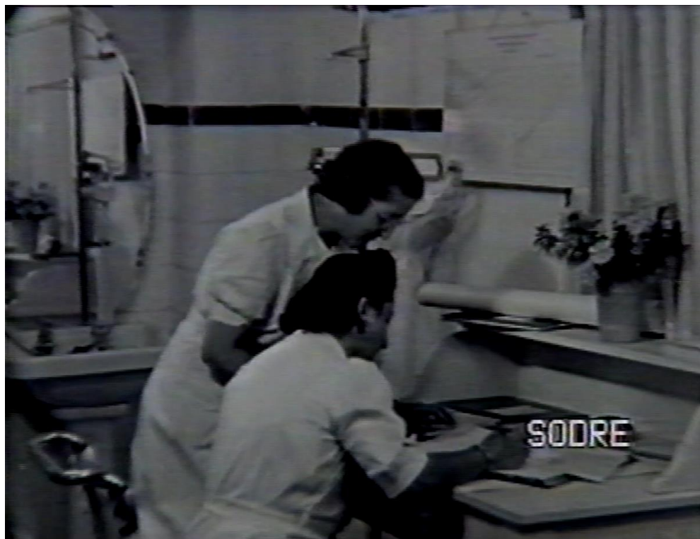
Imagen 3: Personal médico y autoridades