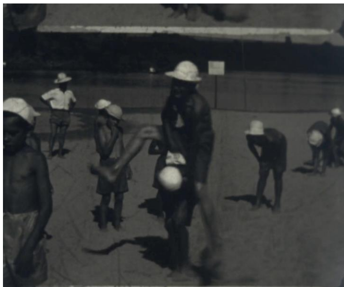
Imagen 2: El rango