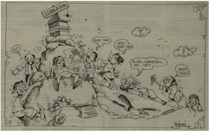
Figura 12. Disculpe , 29/07/1987, contratapa.