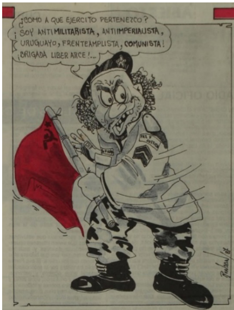
Figura 3. Disculpe , 07/10/1987, contratapa

Desde 1985, esta línea argumental fue sostenida en los actos públicos del Centro Militar durante las conmemoraciones del 14 de abril. Al igual que los mandos en actividad, los militares retirados insistieron en eventos y declaraciones públicas en que se había vivido una guerra que justificaba los «excesos» cometidos y que si bien la guerrilla había sido derrotada la subversión permanecía latente (Marchesi, 2002, pp. 120-121). En una línea similar escribieron los colaboradores del semanario que planteaban la existencia de una «guerra inconclusa» y alertaban sobre las estrategias psicopolíticas de la «sedición». 22