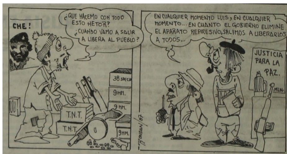
Figura 6. Disculpe , 22/07/1987, contratapa

En estas figuras se condensaba el estigma del haragán, el charlatán y el embaucador como contrapunto del verdadero oriental trabajador, discreto y sencillo que la dictadura buscó asociar con la lealtad a la empresa, a la patria y a la familia patriarcal (Rey, 2021). En este caso se buscó además vincular al militante izquierdista con la lucha armada, al incluir en la caricatura un retrato del Che Guevara y un arsenal de bombas y armamentos, y remitir a temores y estigmas de años anteriores (Correa Morales, 2021). El texto de ambas viñetas aludía a la supuesta incongruencia del sistema político con respecto a la seguridad nacional. Mientras se le garantizaba amplias libertades a la subversión para reorganizarse en todos los frentes, incluida la lucha armada, se desarticulaba la capacidad de defensa de la nación al haber iniciado en 1985 un lento proceso de ajuste presupuestal de las Fuerzas Armadas, abultado durante la dictadura. 25