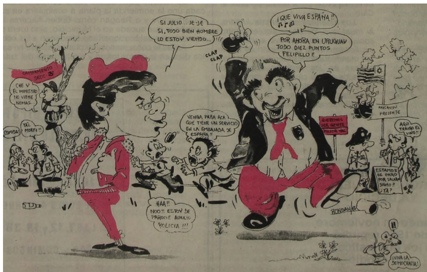
Figura 15. Disculpe , 11/11/1987, contratapa

cia representativa. 41 En definitiva, también en su concepción restrictiva de la democracia, Disculpe utilizaba la burla banalizadora para legitimar el statu quo y la cultura de la impunidad y no para subvertirla, burlarla o desafiarla.