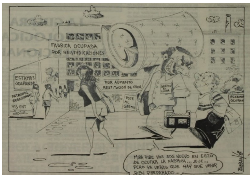
Figura 4. Disculpe , 09/09/1987, contratapa

En otras ediciones se lo representó como un dirigente sindical dedicado a promover la huelga y el libertinaje en los lugares de trabajo, reforzando la idea de que estas medidas de lucha eran en realidad una excusa para incitar al desorden y al desenfreno sexual. Fue el caso de la caricatura del sindicalista que camina detrás de una mujer con un colchón y un radiograbador y le dice a un nuevo trabajador que para ocupar la fábrica «hay que venir bien preparado» (Figura 4), al retomar estigmas sobre el oportunismo y la hipocresía de los dirigentes sindicales (Sosa, 2021).