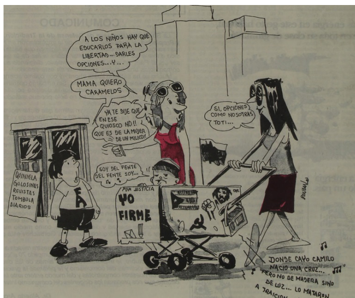
Figura 13. Disculpe , 28/10/1987, contratapa

El diagnóstico decadentista de las notas sobre la «juventud en democracia» y «los jóvenes como carne de cañón» se complementaba con las caricaturas sobre el declive de la familia tradicional promovido por los militantes izquierdistas a los que se acusaba de inculcar un falso discurso de libertad a sus hijos cuando en realidad practicaban el adoctrinamiento familiar. Una caricatura de dos madres con sus hijos, repletos de imágenes y símbolos izquierdistas que remitían a su adhesión al Frente Amplio, la Revolución Cubana y al Partido Comunista se burlaba del doble discurso y el adoctrinamiento ideológico de sus hijos (Figura 13). Estas representaciones de la mujer izquierdista se alejaban de los estereotipos de género de la cultura visual anticomunista anterior al golpe de Estado que las vinculaban a la permisividad sexual, la negación del instinto maternal y la pérdida de atributos femeninos (Rey, 2021). No obstante, se asentaban en los prejuicios denigrantes de la condición femenina de las mujeres izquierdistas, desapegadas de su rol como guardianas del hogar, la moral familiar y el recato público.