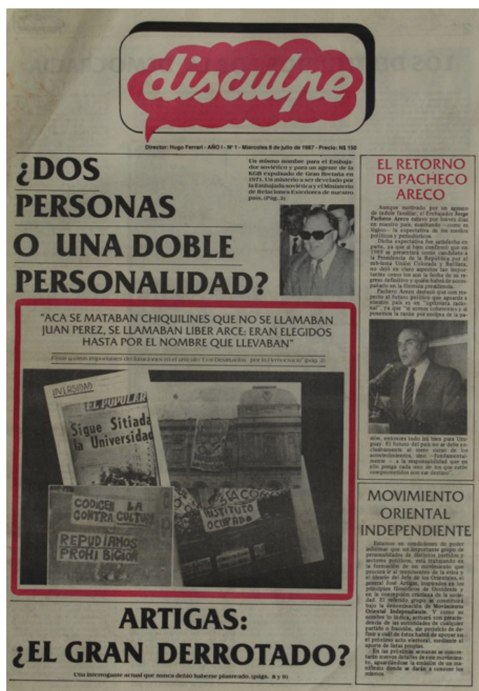
Figura 1. Disculpe , 08/07/1987, tapa

En su prédica combativa, Disculpe alternó el análisis en clave anticomunista de la coyuntura política nacional e internacional con notas elogiosas sobre la labor patriótica de las Fuerzas Armadas y catastróficas sobre las acciones de sus principales enemigos. 13 Su cobertura de la escena nacional se centró en denunciar el «proselitismo marxista» en la enseñanza media, el carácter «totalitario» de la Universidad de la República y el «terrorismo sindical» del PIT-CNT. 14 Una línea argumental común de estos artículos fue el rechazo a la libertad para «adoctrinar» a la juventud que atribuían a tupamaros