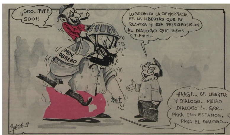
Figura 8. Disculpe , 11/11/1987, p. 10