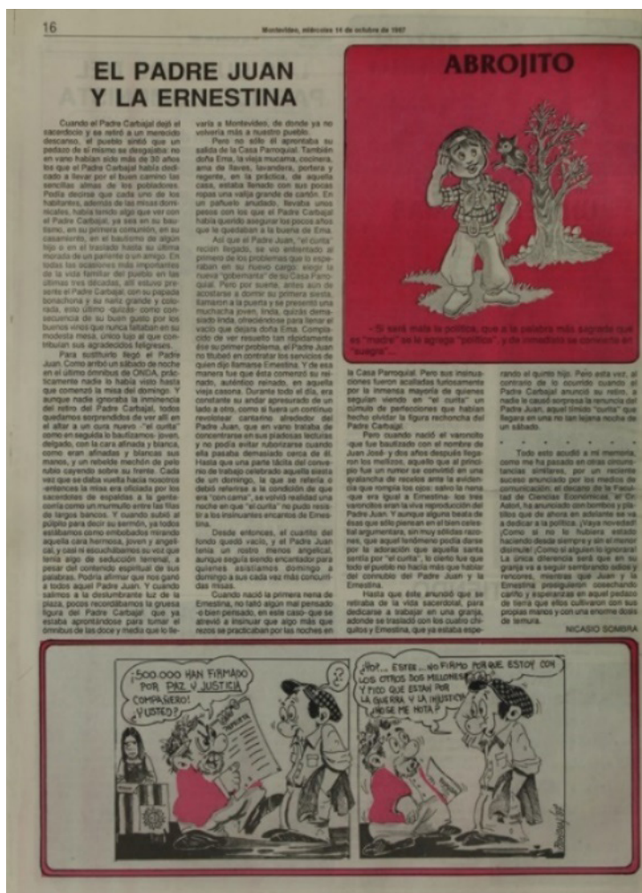
Figura 2. Disculpe , 14/10/1987, contratapa