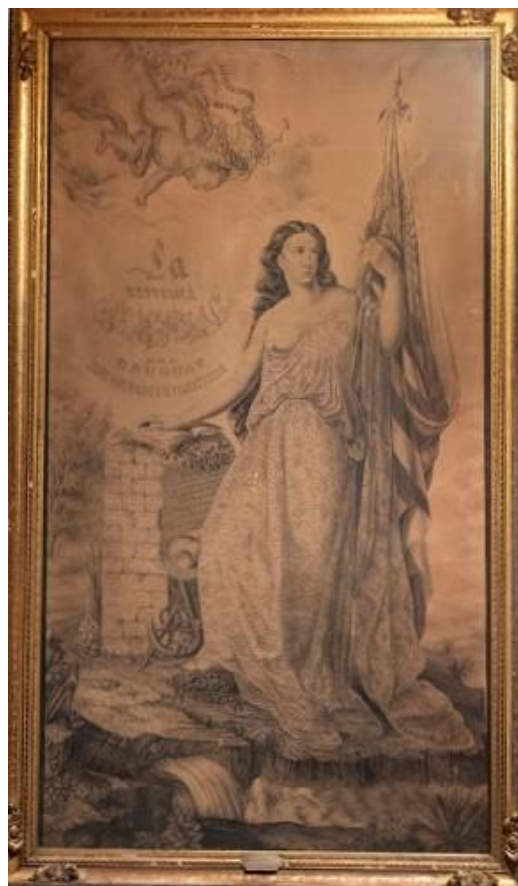
Imagen 1. Pablo Nin y González. «La República Oriental del Uruguay Libre, Independiente y Constituida». 1865-66. Cuadro Caligráfico.

En paralelo a la actividad pública que desempeñó Nin y a sus tareas como taquígrafo en el Senado, la actividad desde la que se proyectó profesionalmente fue la de calígrafo. Desde su juventud usó su destreza para producir imágenes que homenajearan figuras públicas o hechos históricos que consideraba dignos de destaque. Siempre con una fuerte intención ética y pedagógica.