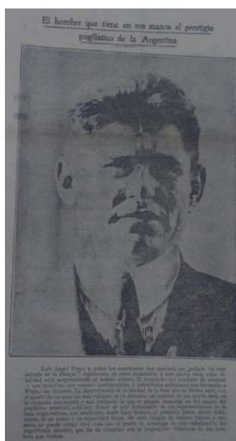
Imagen 5. La Época [Buenos Aires], set. 14, 1923: 13

Una de las notas del periódico La Época , que pertenecía a la sección especial de 20 páginas, publicada el mismo día en que se hizo la pelea, ocupó casi la totalidad de una página con la fotografía del rostro de Luis Ángel Firpo. Esta fotografía estaba bajo el título de «El hombre que tiene en sus manos el prestigio pugilísticos de la Argentina» (Imagen 5), con un pequeño texto debajo. 16