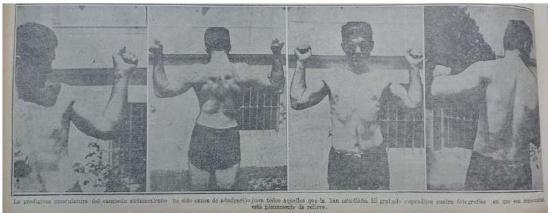
Imagen 4. La Época [Buenos Aires], set. 14, 1923: 20 12

hombres que poblaban la Argentina. En este sentido, Mosse (1998) plantea que la construcción de la masculinidad moderna depende de la relación entre alma, cuerpo, moralidad y estructura corporal, una relación que pretende ser natural para volverse estándar de la normalidad, procurando construir patrones normativos de moralidad y comportamiento. Así, la masculinidad tiene que ser cultivada y desarrollada con constancia, implica un cultivo corporal y moral a través de distintos hábitos y conductas socialmente establecidas como sanas y masculinas . Uno de los vehículos más utilizados y eficaces para instalar como hegemónicas ciertas masculinidades, y como saludables en términos físicos, intelectuales y morales ciertas conductas, fueron las prácticas deportivas. A lo largo del siglo XX, principalmente en sus comienzos, los deportes estuvieron bajo la legitimidad de las ciencias médicas y fisiológicas, convirtiéndose así en un bien necesario para el mejoramiento y desarrollo de las aptitudes físicas, intelectuales y morales de los cuerpos individuales y poblacionales.