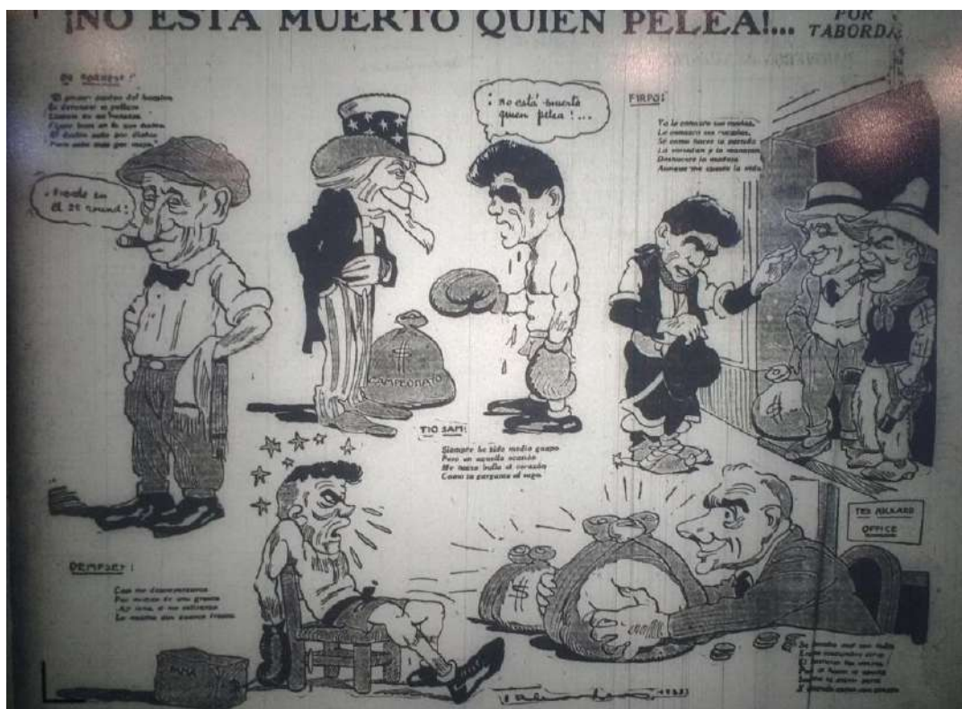
Imagen 8. Crítica [Buenos Aires], set. 15, 1923: 2

también fue reflejado en las caricaturas «No está muerto quien pelea» (Imagen 8), «¿Ha sido una pelea o un asesinato alevoso?», 32 «¡No hay plazo que no se cumpla!», 33 entre otras más.