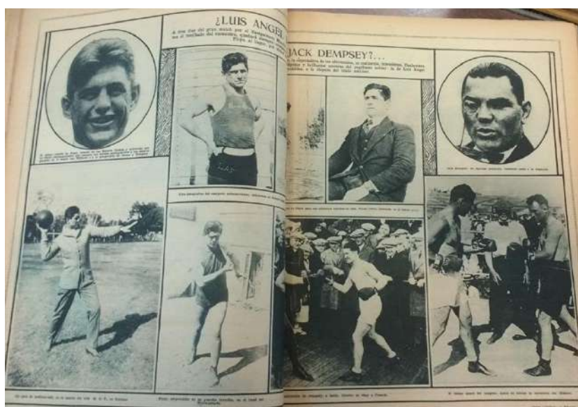
Imagen 2. Fray Mocho [Buenos Aires], set. 11, 1923: 594, Carlos Correa Luna

Otro de los aspectos analizados es la incesante intención de transmitir la vida del ídolo nacional en su estadía en los Estados Unidos. Había una necesidad por transmitirlo todo. Sus entrenamientos, descansos, salidas, paseos, comidas, visitas, compañías femeninas, amigos y también sus estados de ánimo. Todo debía ser informado, narrado, comentado y mostrado por la prensa escrita.