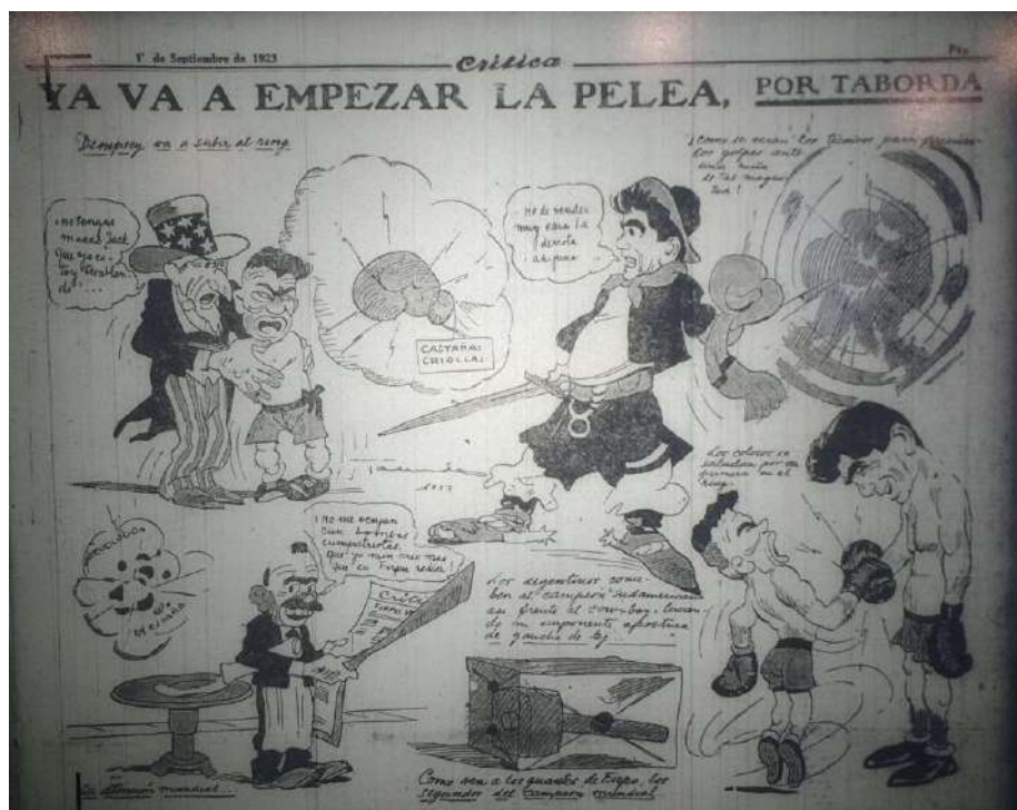
Imagen 7. Crítica [Buenos Aires], set. 14, 1923: 5

Por otro lado, el Tío Sam y Jack Dempsey están aterrizados por la fuerza de las castañas criollas y la brutalidad del coloso de Firpo. A su vez, esta caricatura refleja la importancia que los medios de comunicación locales le daban a la pelea de boxeo, ya que intentaban transmitir que toda la atención del mundo estaba puesta en este evento deportivo, dejando de lado cualquier otro tipo de acontecimiento, hasta la revolución española que se estaba llevando a cabo en el continente europeo.