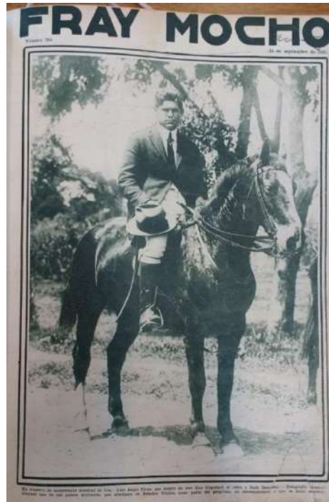
Imagen 1. Fray Mocho [Buenos Aires], set. 11, 1923: 596, Carlos Correa Luna

Esta fotografía (Imagen 1) fue la tapa de Fray Mocho el 11 de setiembre de 1923 con un pequeño texto acompañándola. 6 Dicha fotografía fue obtenida, y no de manera casual, durante uno de los paseos matinales de Firpo en los Estados Unidos como parte de su programa de entrenamiento. La postura, el peinado, su mirada y vestimenta, el paisaje que hay detrás, el caballo, la forma en que lo está montando y la posición de la cámara fueron elegidos antes. Vestido de traje, con botas para montar, con sombrero y arriba del caballo era como Firpo hacía sus paseos por la ciudad, siendo fiel a sus costumbres nacionales.