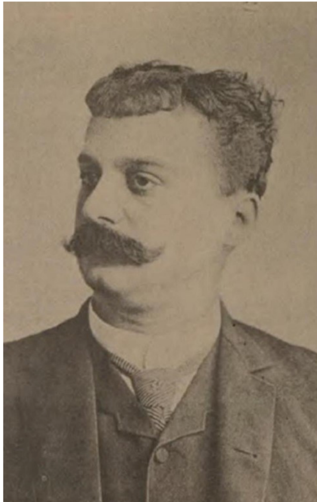
Imag. 4. El Cojo Ilustrado , «Fernando Michelena» (Fotograbado) 1892.

En cuanto al talento nacional, dos caballeros se ganaron la crítica de El Cojo Ilustrado a finales del siglo XIX, augurando su éxito posterior. En marzo de 1892 fue retratado Fernando Michelena ( Imag. 4 ), venezolano, primer tenor absoluto. [31] Para la fecha, Michelena ya destacaba desde las fiestas del Primer Centenario del Libertador Simón Bolívar, cuando los señores Toledo Bermúdez y Michelena contrataron la compañía de ópera italiana de nombre Empresa Lírica bajo el auspicio del general Antonio Guzmán Blanco.[32] En la nota biográfica de la misma publicación, se informa que nació en Choroni en 1857. En 1881 fue enviado a Europa por cuenta del Gobierno para perfeccionarse en el canto y al año siguiente ya era reseñado con elogios por la prensa italiana, reproducida por la de Caracas. En julio de 1884 fue contratado por tres años por la Compañía Abbot. El Cojo Ilustrado «envía un saludo al amigo y un aplauso al tenor. El repertorio del tenor Michelena consta nada menos que de una veintena de óperas y en todas ellas se ha distinguido como cantante de buena escuela, de voz melodiosa y artista dramático».[33]