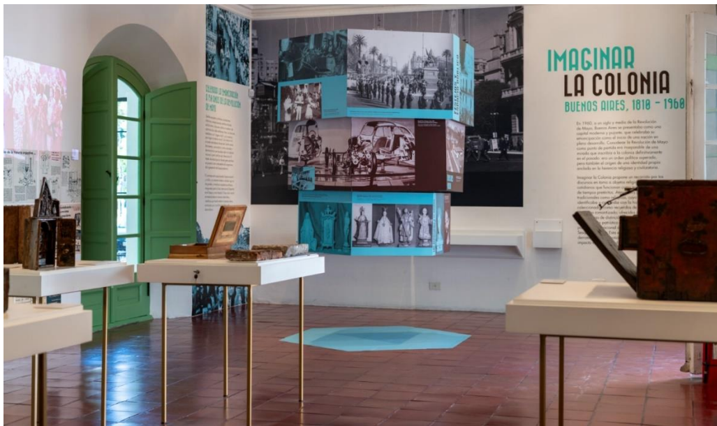
Fig. 3. Vista de sala Imaginar la colonia. Buenos Aires, 1810-1960, Museo Histórico Nacional del Cabildo y de la Revolución de Mayo.

De este modo, el hexágono estuvo organizado en tres anillos: en su registro superior exhibimos fotografías de los festejos en el espacio público, entre los que destacaron los desfiles por la avenida del Libertador y los festejos en Plaza de Mayo; el registro medio presentó vistas exteriores e interiores de los pabellones industriales y los mencionados monumentos de la feria; mientras que el registro inferior reprodujo imágenes de algunas de las obras que se exhibieron en el Pabellón de la Cultura Popular, en cuyo interior se exhibieron piezas prehispánicas procedentes de museos provinciales junto con imágenes y objetos tardocoloniales. Estos objetos –en una clara reminiscencia del nacionalismo indigenista y el fervor neocolonial de las primeras décadas del siglo XX– evocaban los orígenes y las raíces identitarias de nuestro país rescatando las técnicas autóctonas de la cerámica prehispánica y coloniales de la imaginería y el trabajo artesanal bajo el común denominador de «arte popular». 12