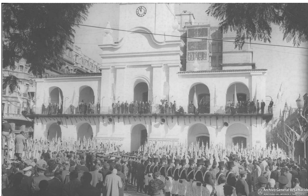
Fig. 2. Discurso del presidente Arturo Frondizi en los festejos del 150.º aniversario de la Revolución de Mayo, 22 de mayo de 1960, fotografía, Acervo Gráfico, Audiovisual y Sonoro, AGN, inv. 270966.

conservaba de su gloriosa gesta patriótica, a pesar de que su arquitectura había sido profundamente transformada en el siglo XIX, reconstruida en 1940 por el reconocido arquitecto Mario Buschiazzo (cfr. Schavelzon 2008; García 2020) y modificada y ampliada veinte años después para su adecuación como sede del nuevo museo. Así, entonces, en 1960 el emblemático Cabildo fue el telón de fondo de discursos oficiales, desfiles militares y tradicionales, recepción de comitivas extranjeras y múltiples festejos que se prolongaron por toda la Semana de Mayo y que habían sido preludiadas desde comienzos de año en la prensa periódica con gran entusiasmo.