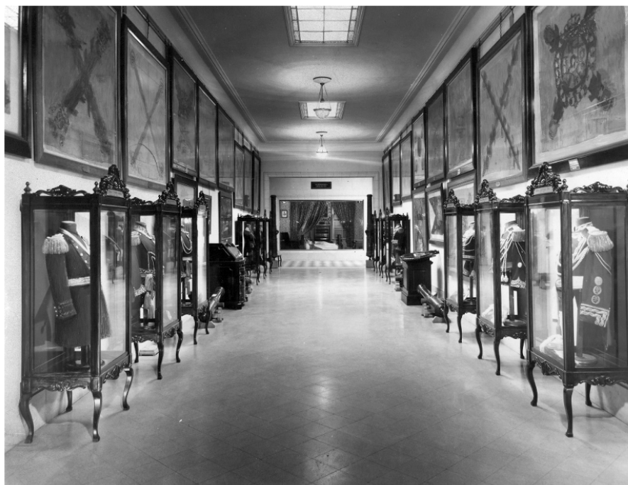
Imagen 4: Sala contigua al dormitorio de José de San Martín, Museo Histórico Nacional, 1939.

El 17 de agosto de 1935 se inauguraron con gran despliegue los nuevos espacios sanmartinianos. Estuvieron presentes un escuadrón del Regimiento de Granaderos a Caballo, la banda musical del Colegio Militar, los ministros de las carteras de Educación y de Guerra y los más conspicuos miembros de la JHNA, que celebró una sesión de homenaje. Como era esperable también estuvo representada la Iglesia ya que la bandera donada por los generales había sido confeccionada por las Hermanas del Colegio del Divino Rostro. Antes del desarrollo de la ceremonia fue bendecida en la Capilla de Nuestra Señora del Carmen, Patrona del Ejército de los Andes, por monseñor Gustavo Franceschi.