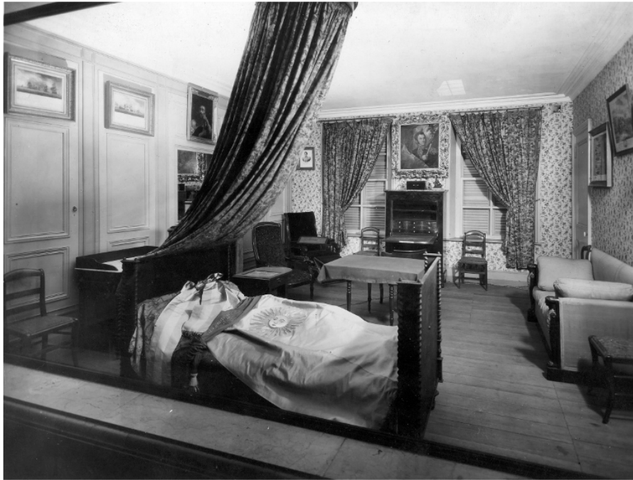
Imagen 3: Reconstrucción del dormitorio de José de San Martín, Museo Histórico Nacional, 1939. AH-MHN-FMHN. Sección Registro. Fotografías.

se posicionó contra la comprensión puramente intelectual de la historia, dejando en claro que los museos no eran equivalentes a los libros. «No basta el método de exposición para que el Museo sea docente — sostenía —, la docencia exige factores de más profunda sugestión» (Museo Histórico Nacional 32).