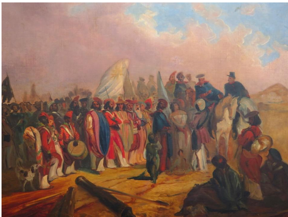
Retorno de Garibaldi después del combate de San Antonio. J.M. Rugendas, 1846. Óleo. MHCM

Como era común en los conjuntos iconográficos, Assunção reunió decenas de retratos de políticos, militares, escritores, artistas y religiosos del siglo XIX, sumando más de 200. Luego de los dos primeros presidentes de la República, la personalidad de quien reunió la mayor iconografía es Garibaldi, constando la colección de siete retratos del legionario, en su mayoría grabados. De uno de ellos el coleccionista tenía además la chapa de acero con la efigie de Garibaldi que se utilizó en París a partir de 1859 para producir los grabados. Además, la colección incluía un mapa con el camino a la tumba de Garibaldi en Caprera.