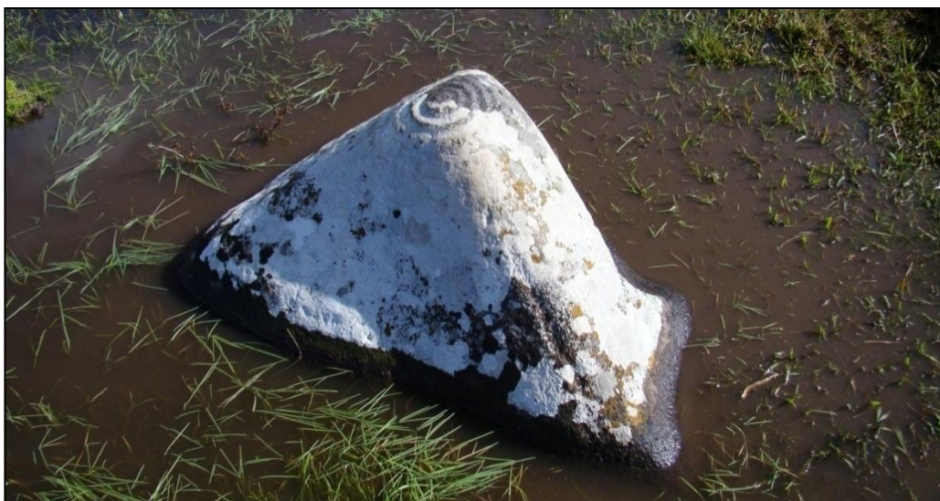
Figura 2. Petroglifo ubicado en el Dpto. de Paysandú.