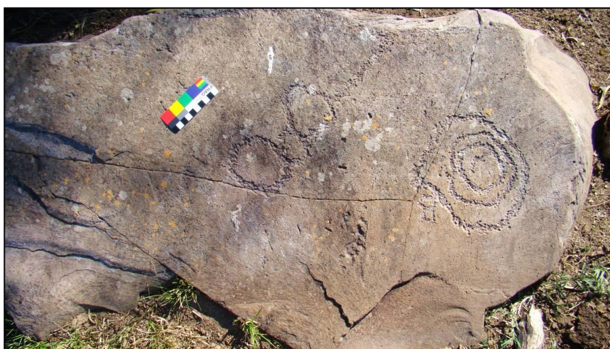
Figura 4. Petroglifo del Departamento de Artigas.