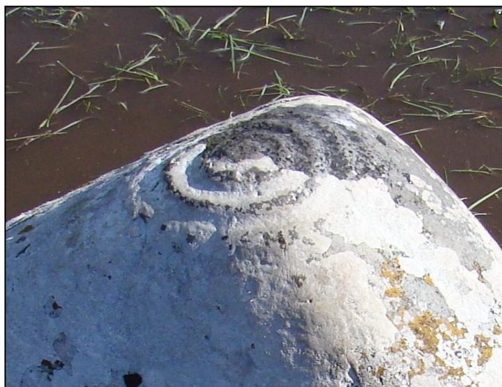
Figura 3. Detalle del diseño.